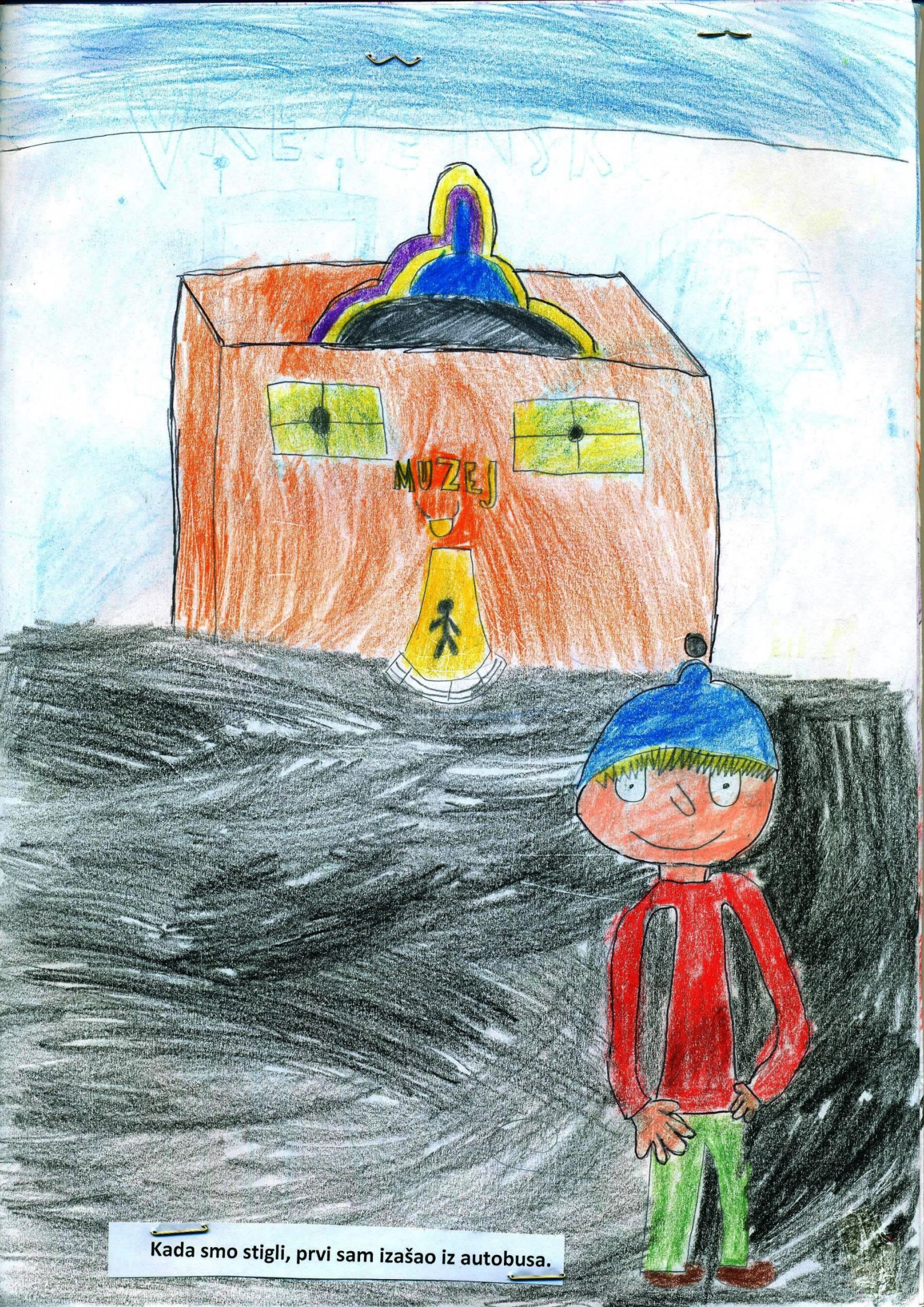
Kada smo stigli, prvi sam izašao iz autobusa.